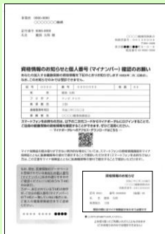
①資格情報のお知らせ (⇒ 拡大版 )

※当組合の事務所が2024年11月11日付で移転しますので、健康保険証の保険者情報部分に貼付けてください。発行済の健康保険証は廃止後も2025年12月1日まで使用できます。